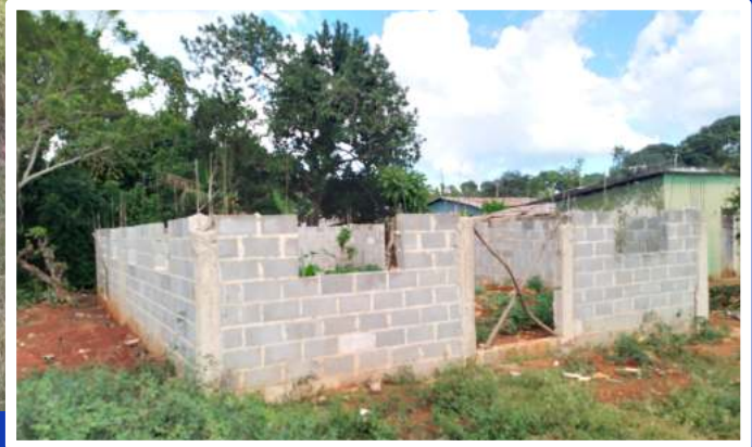
AVANCES EN LA CONSTRUCCIÓN DE UN CENTRO COMUNAL EN JUAN SÁNCHEZ